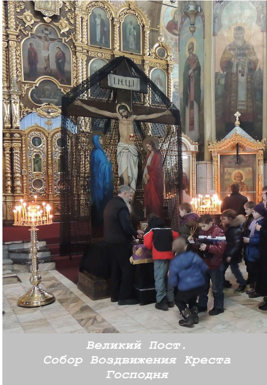
Великий Пост. Собор Воздвижения Креста Господня

Именно весной человек-земледелец полагает начало трудам, плоды которых, возможно, будут кормить его весь следующий год — он наводит порядок на поле, в огороде или на даче, выдергивает на своем участке сорняки, пашет землю, сеет... Также и Великий пост — весна духовная — самое подходящее время, чтобы привести в порядок поле своего сердца: удалить отсюда удалить отсюда сорняки грехов, вспахать душу покаянием, удобрить и засеять его Божественными семе-